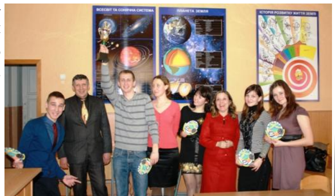
Щасливі переможці – команда «Карпати»

Завдання конкурсів Географічного турніру були